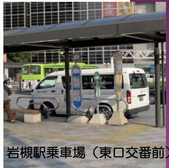
岩槻駅乗車場 (東口交番前)